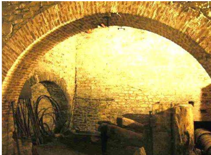
L'interno dell'edificio centrale: si notano i magli e alcuni strumenti di lavoro

invogliare così la popolazione a trascorrere durante l'estate i loro pomeriggi a contatto con la natura con la possibilità di effettuare pic-nic, inoltrarsi lungo il “percorso natura” oppure effettuare visite guidate all'interno di queste antiche fonderie per apprendere le antiche tecniche di lavorazione del rame e riscoprire un'autentica “perla nascosta nel sottobosco”, patrimonio storico-naturalistico di tutti noi agnesi.