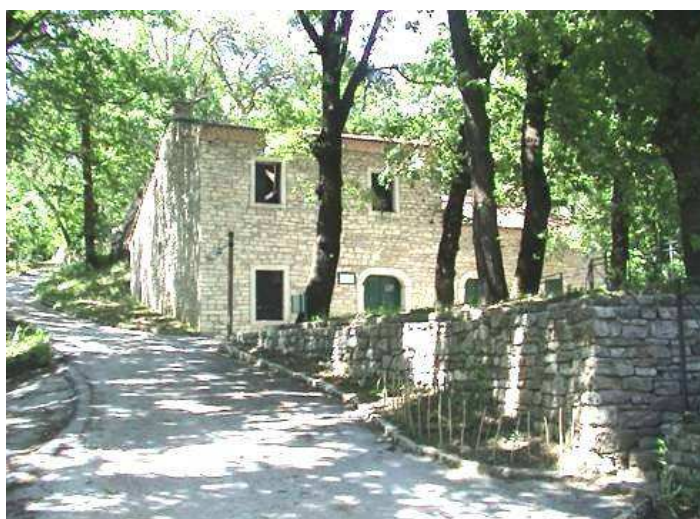
L'edificio centrale delle Antiche Fonderie del Rame

Tale struttura ha subito parecchie modifiche nel corso dei secoli (le ultime avvenute durante i primi vent'anni del '900) e ha continuato a funzionare fino alla fine degli anni '70. Esattamente come nel 1754, la Vecchia Ramera conta tre grandi fabbricati che si ergono nel cuore di quella gigantesca "V" che il Vallone del Cerro e il Verrino disegnano nella fitta boscaglia prima di fondersi in un unico fiume. Il funzionamento dei "magli" era garantito convogliando le acque del Verrino all'interno degli edifici tramite un ingegnoso sistema di chiuse, vasche e mulini che sfruttava in maniera eccelsa la pendenza della zona. Grazie ai lavori di manutenzione, effettuati dal Comune una decina di anni fa, l'antico ambiente di lavoro si è conservato perfettamente. Da tempo ormai la struttura non svolge più la sua funzione originaria e oggi mi piace considerare la Vecchia Ramera una sorta di museo che testimonia in maniera eccezionale l'abilità dei nostri antenati nello sfruttare egregiamente le risorse di madre natura in condizioni di lavoro che oggi sarebbero improponibili.